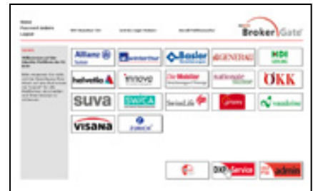
Jumping Page gemäss Planungsstand Ende 2014